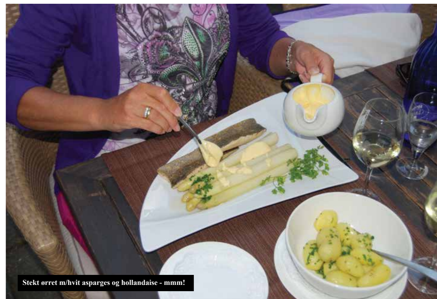
Stekt ørret m/hvit asparges og hollandaise - mmm!