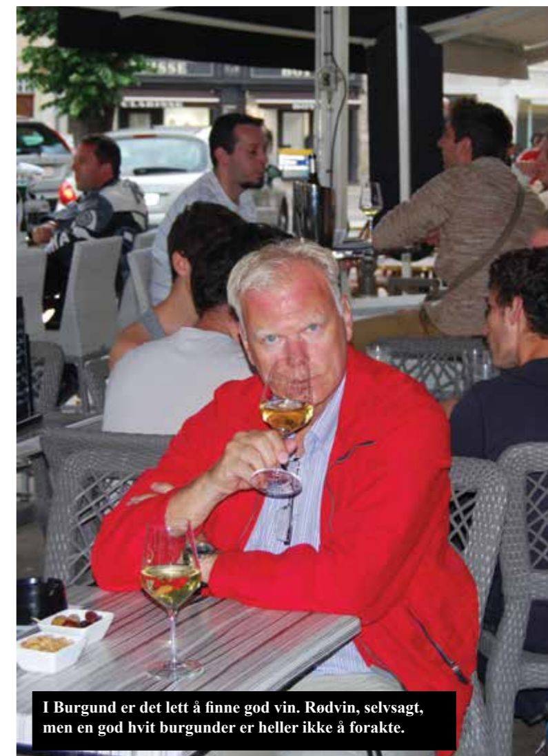
I Burgund er det lett å finne god vin. Rødvinn, selvsagt, men en god hvit burgunder er heller ikke å forakte.