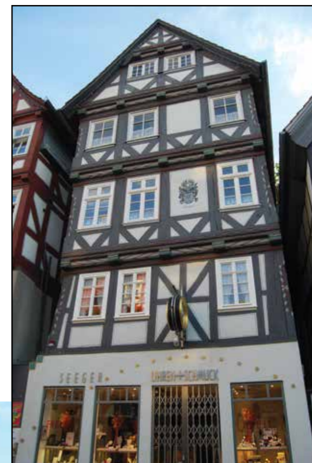
Praktfulle bindingsverkshus i Melsungen

Beaune ligger ca 15 mil nord for Lyon, og er hjertet i vindistriktet Bourgogne, og ligger bare et par kilometer unna A6. Vi hadde booket oss inn på det utrolig sjarmerende Hotel Belle Epoque, som lå rett utenfor Beaune's vakre gamleby. Hotellet, som har en del av innredningen i Art Deco-stil, kunne også by på god og trygg parkering inne i bakgården – noe som er veldig viktig å tenke på når man bestiller hotell!