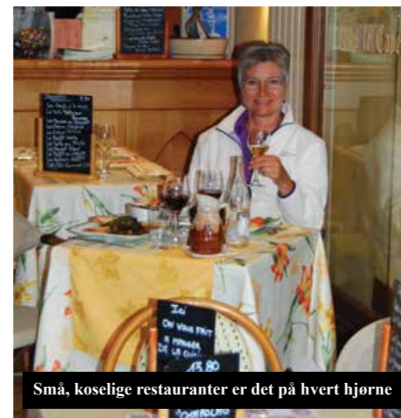
Små, koselige restauranter er det på hvert hjørne