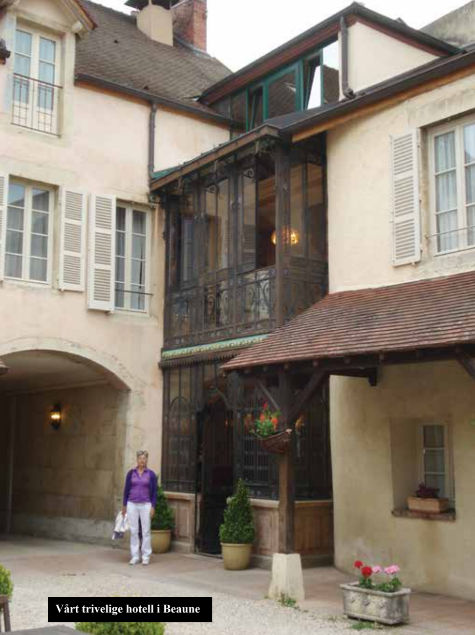
Vårt trivelige hotell i Beaune

Vi ankom dessverre Beaune litt for sent til å kunne besøke den største vinbodegaen av dem alle – Patriarche – så det får bli en annen gang. Men en hyggelig byvandring gjennom de sentrale deler av Beaune fikk vi, og fant (selvsagt!) en trivelig restaurant med utsikt mot et hyggelig torg.