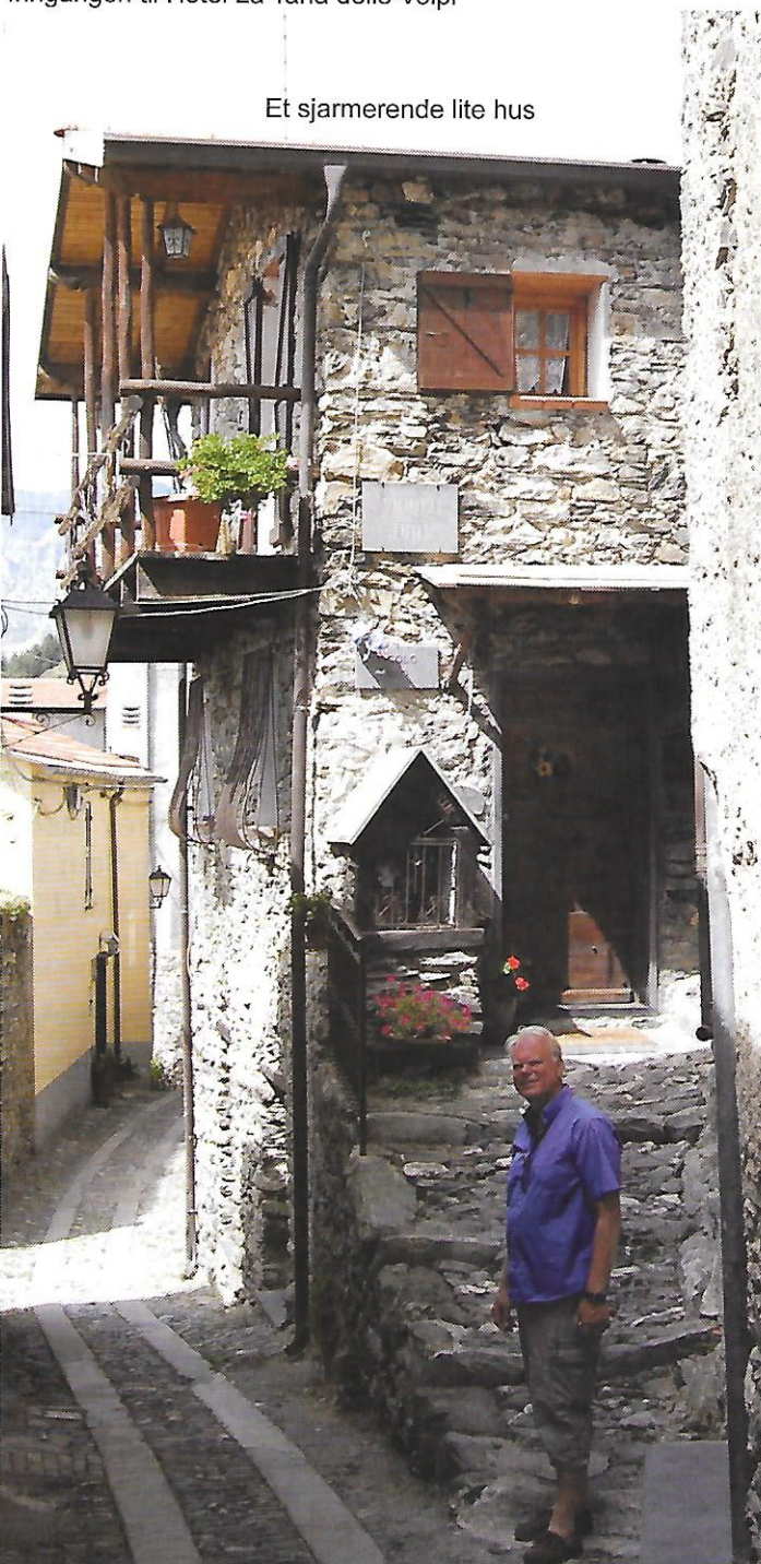
Et sjarmerende lite hus