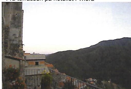
Fra terrassen på hotellet i Triora