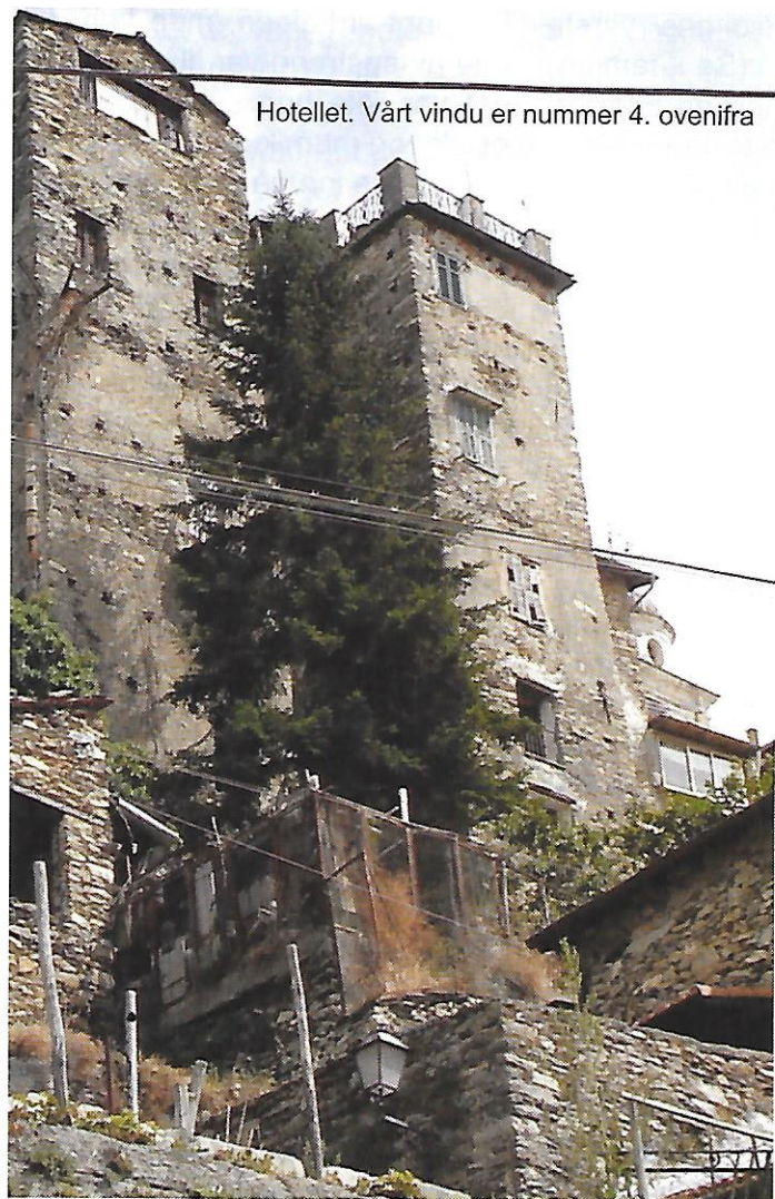
Hotellet. Vårt vindu er nummer 4. ovenifra