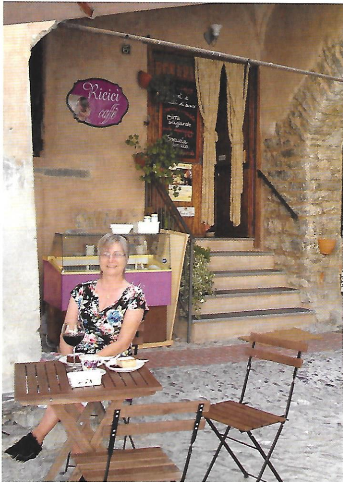
Frokost på kaféen