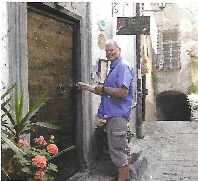
Inngangen til Hotel La Tana delle Volpi