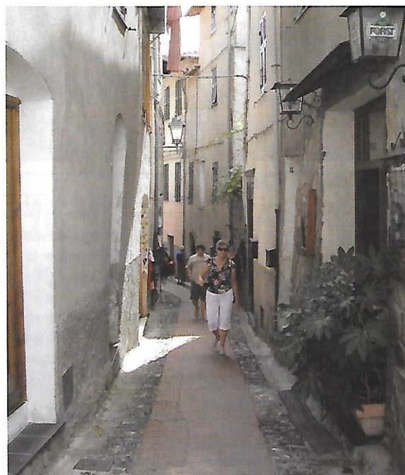
Hovedgaten i Triora

Selv om Triora kan se ut som den er tatt rett ut av den mørkeste middelalder, er Triora i dag rene idyllen med smale, bilfrie gater, omgitt av oliventrær og blomstrende mimosa. Lite vitner om grusomhetene som fant sted her i årene 1587-89: I den vesle landsbyen høyt oppe i fjellene ble et 30-talls kvinner helt ned i tenårene samlet i kirken. Inkvisitoren, anført av biskopen i Albenga, gjorde dem til synde-bukker for to års hungersnød; hekser var de! Djevelens håndlangere! Kvinnene ble forfulgt, fengslet, lemlestet og pint. Mange av dem døde under tortur eller sultet i hjel i fangenskap. Andre kastet seg ut fra bygninger for å slippe lidelsene.