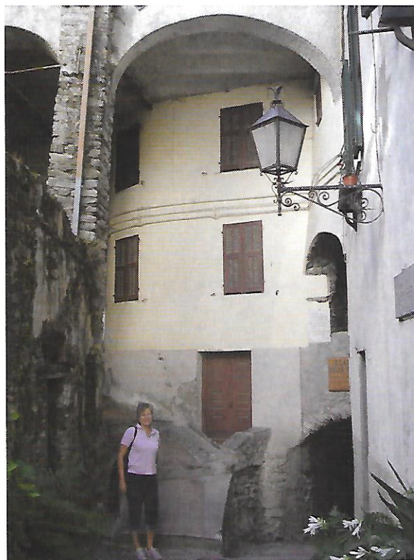
På vei til frokost

Så en avstikker til Triora anbefales dersom man ønsker å oppleve en ganske så annerledes landsby, stille, rolig og ensomt en times kjøring fra den travle middelhavskysten i Italia.